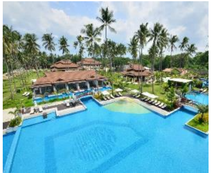
公主花園島渡假村 / 後3晚 Princesa Garden Island Resort & Spa

色彩繽紛明亮客房配有WI-FI、電視、保險箱和沏茶 / 泡咖啡設備。設有餐廳、健身房、泳池、熱水池和酒吧的頂樓露台。