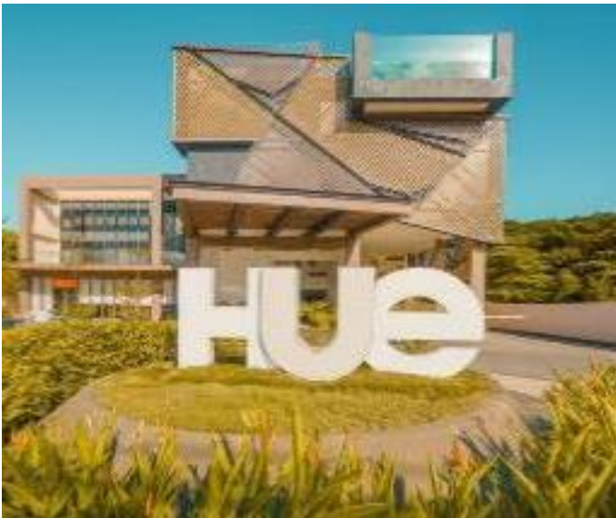
普林塞薩港順化度假飯店 / 後3晚 Hue Hotels and Resorts Puerto Princesa

設有室外泳池及花園；客房設有陽台，享有花園和泳池美景，配備空調、免費 WI-FI、座椅休憩區、沙發和私人衛浴配有淋浴和免費盥洗用品。