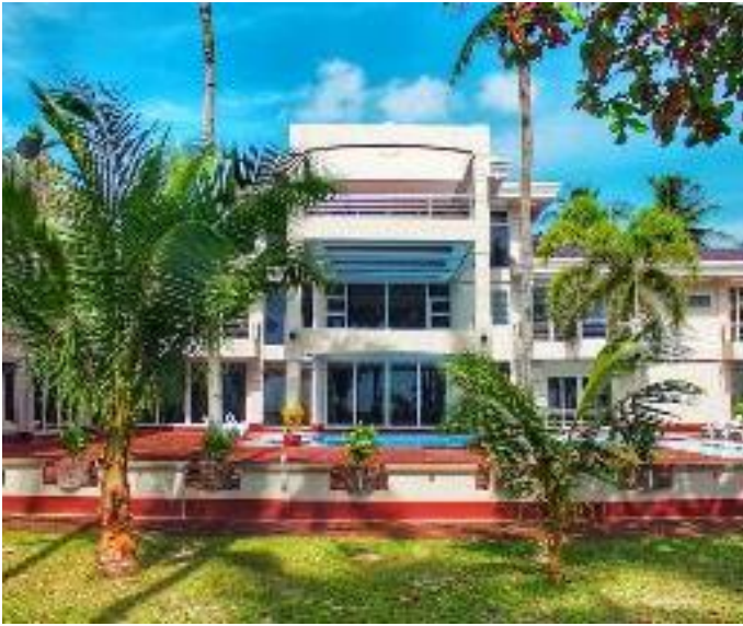
巴拉望海岸度假村 / 後2晚 Costa Palawan Resort

度假村面朝海濱，提供室外游泳池、健身房和花園。設施有餐廳及覆蓋各處免費 WiFi。客房均配有空調、電視、冰箱、坐浴盆及免費洗浴用品。