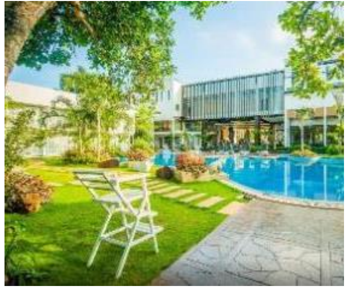
阿齊扎天堂酒店 / 後2晚 Aziza Paradise Hotel

度假村面朝海濱，提供室外游泳池、健身房和花園。設施有餐廳及覆蓋各處免費 WiFi。客房均配有空調、電視、冰箱、坐浴盆及免費洗浴用品。